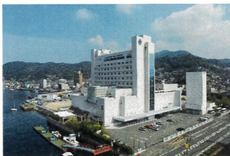
ご宿泊はクレイトンベイホテル