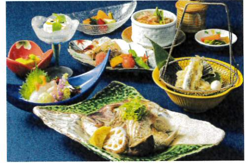
ご夕食は「呉あじめぐり会席」をご用意